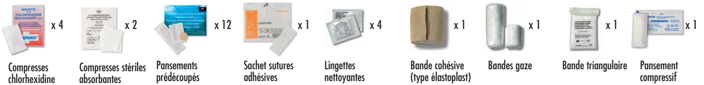
Compresses chlorhexidine x 4